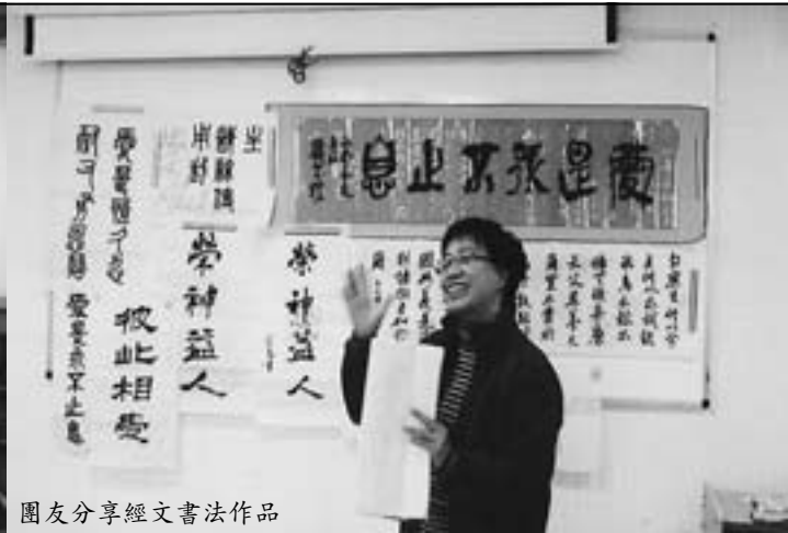
團友分享經文書法作品