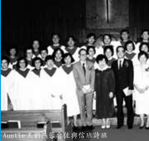
Auntie 王劉燕蓉會佐與信班詩班