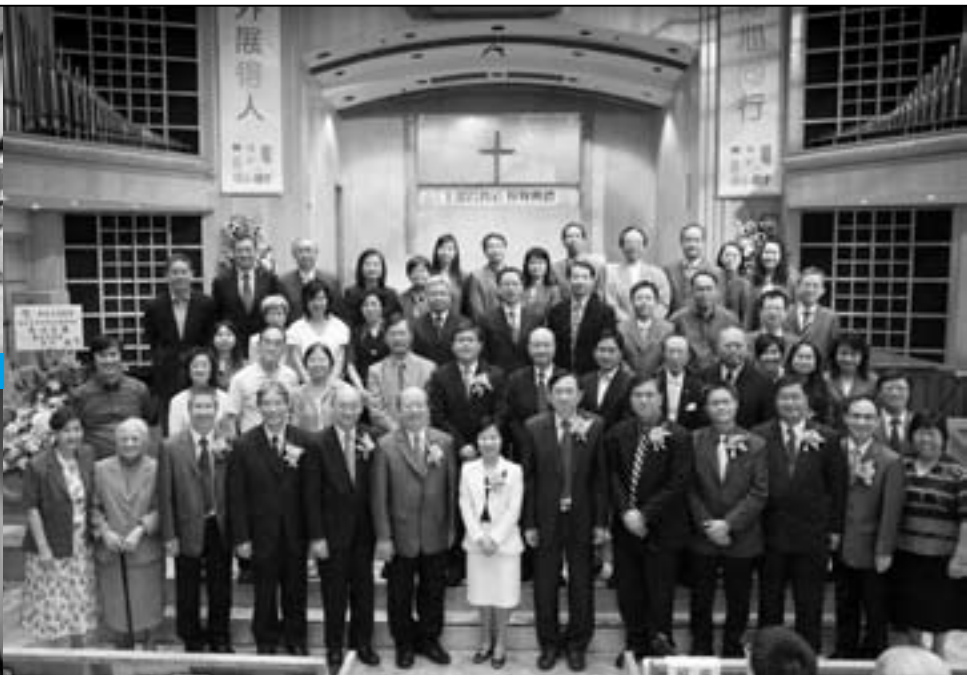
與教牧同工、會佐的大合照