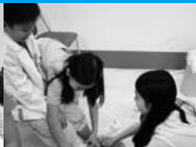
做做耶穌為門徒洗腳