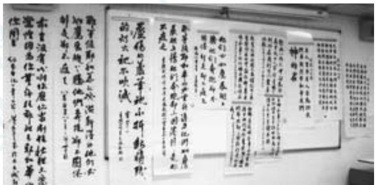
作品滿滿張貼在會議室牆上

我的字體一向不甚工整，常常受到母親及老師的批評，也自覺慚愧。數年前下定決心去作些補救工夫，報讀了一所大學的校外書法藝術課程，除了在書寫技巧下功夫外，對於中國書法的發展史更產生了濃厚興趣。2008年5月我參加了教會的書藝團契，每月一次跟喜愛臨池的弟兄姊妹聚會，