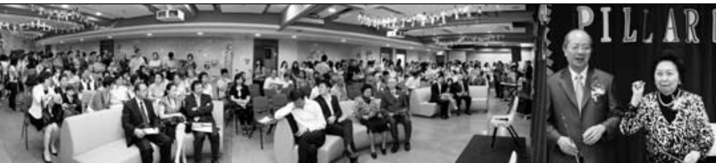
青少年中心PILLAR啟動禮於7月12日（主日）上午於十樓舉行，又於九樓有感恩崇拜及聯FUN午宴。求主使用PILLAR成為青少年認識耶穌和成長的園地。