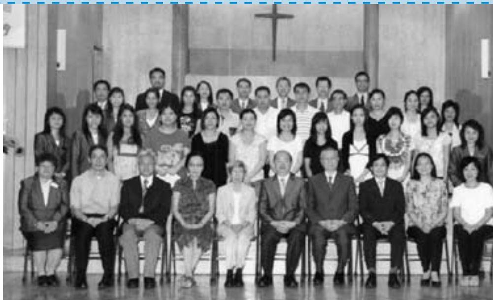
7月12日浸禮 於下午三時舉行。有14人受浸加入教會，6人轉會。求主祝福他們，在主裡繼續成長。